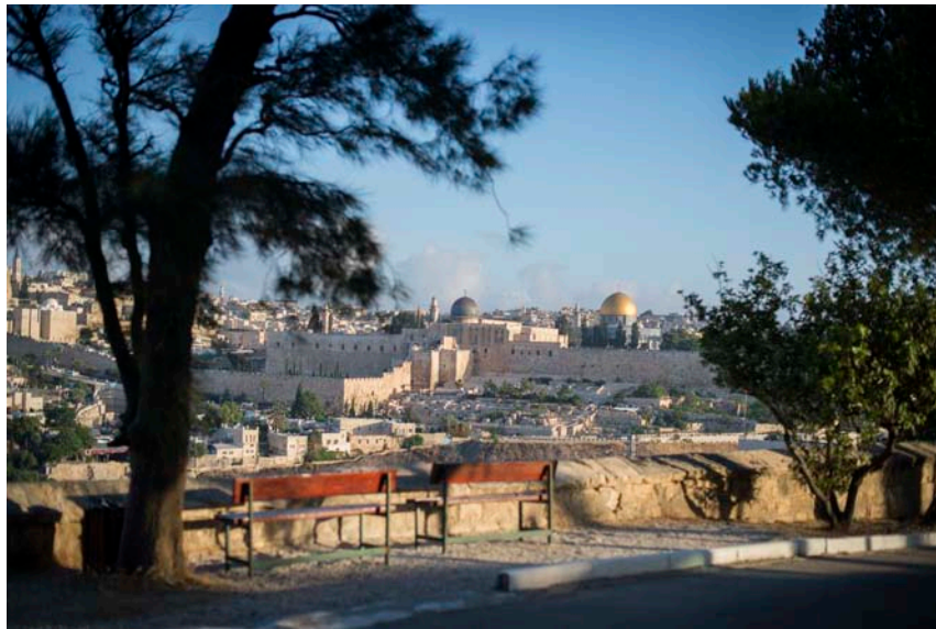
panorama depuis la Maison d'Abraham

Pour ceux qui feront le choix de la Maison d'Abraham , merci d'indiquer vos souhaits (dates de séjour, horaire d'arrivée à l'aéroport, repas du soir) lors de l'inscription au congrès. Les réservations seront effectuées par l'intermédiaire du Centre de recherche français à Jérusalem (CRF) qui versera les arrhes. Les nuitées devront être payées par les participants à leur arrivée.