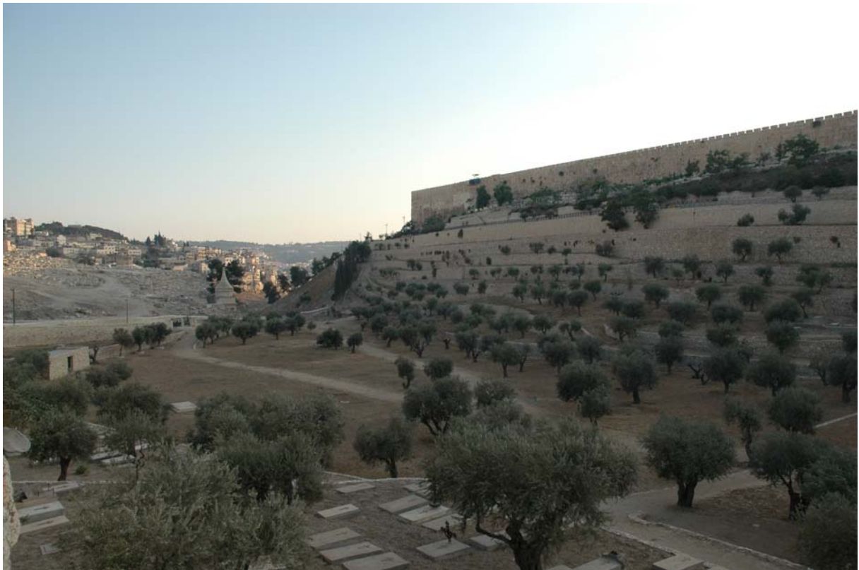
Jérusalem, vallée du Cédron/de Josaphat