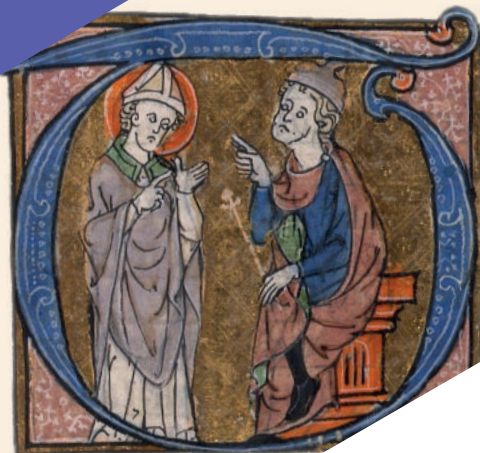
Saint Cyprien de Carthage et le proconsul, missel de l'abbaye de Montier-la-Celle (Champagne), fin XIII e – début XIV e siècle Paris, Bibliothèque nationale de France, nouvelles acquisitions latines 3241, fol. 131 r o